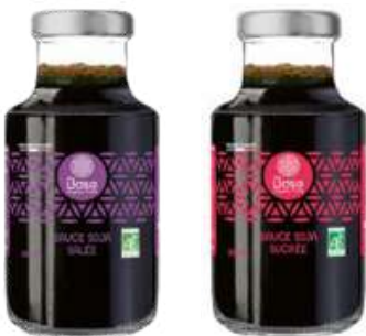
Sauces soja sucrée et salée - 250ml

Nouvelle gamme de cuisine à base de coco !