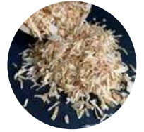
Oignon déshydraté - 500g