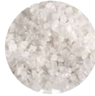
Fleur de sel Guérande IGP - 5kg